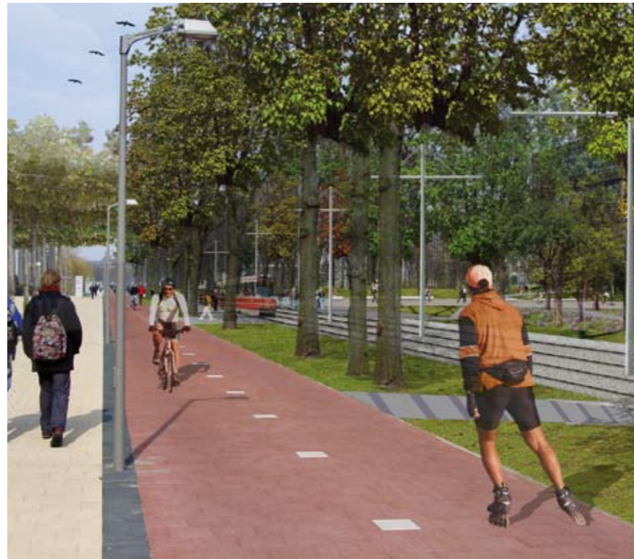
november 2007 / November 2007